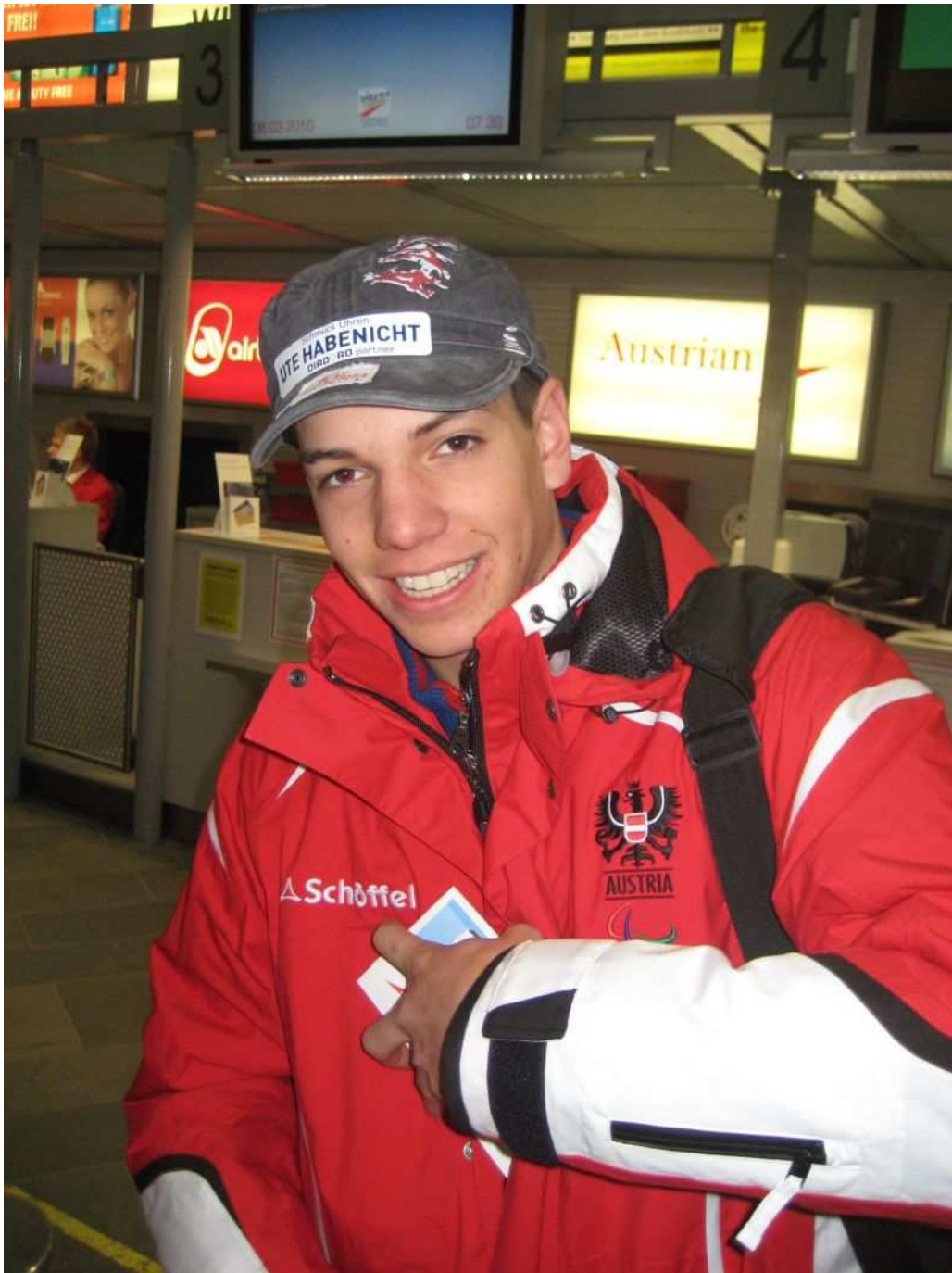
und los geht's ...